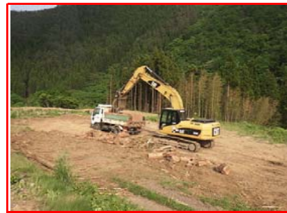
⑨施工：戸田・岩田地崎JV

工事用道路を作るため仮橋をかけています。 工事用道路への右折レーン設置工事を行っています。