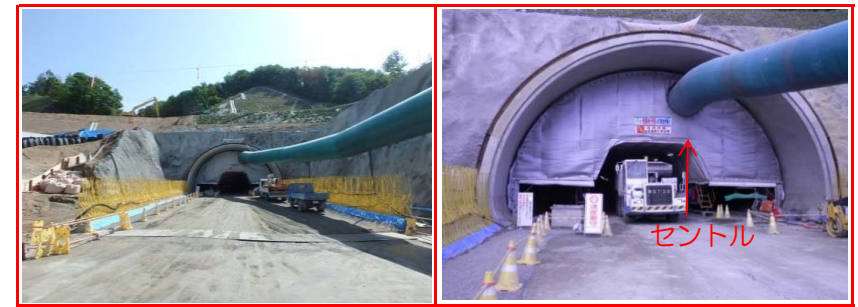
②施工：前田建設工業

トンネル終点側(盛岡側)の坑口部です。トンネルは、1,100mのうち約400m掘り進んでいます。 センターと呼ばれる移動式の型枠を使って、コンクリートの巻立工事も開始しました。